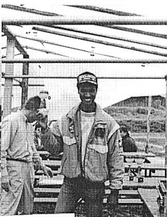
L'élite genevoise du buggy 1/8 en Suisse