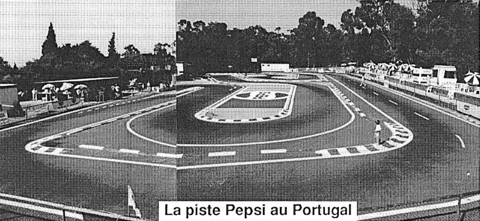
La piste Pepsi au Portugal