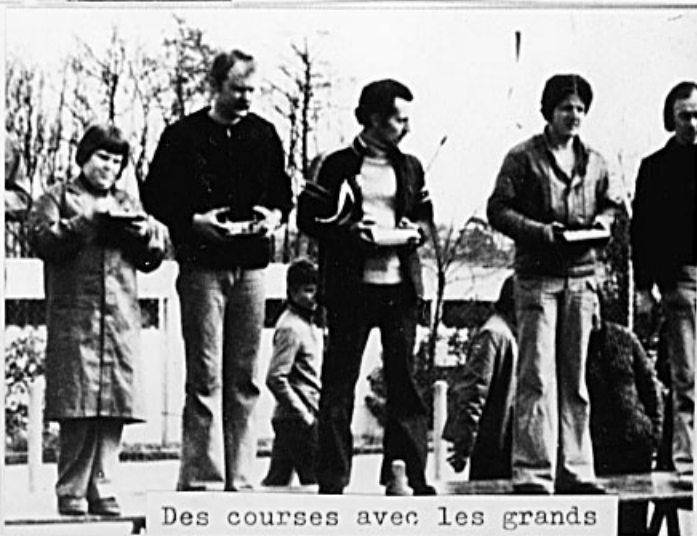
Des courses avec les grands