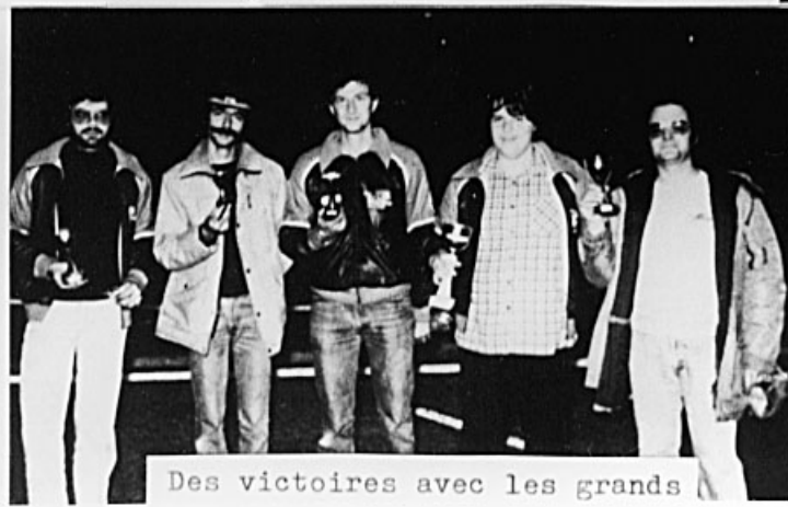
Des victoires avec les grands