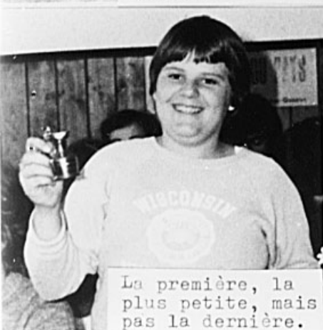
La première, la plus petite, mais pas la dernière.