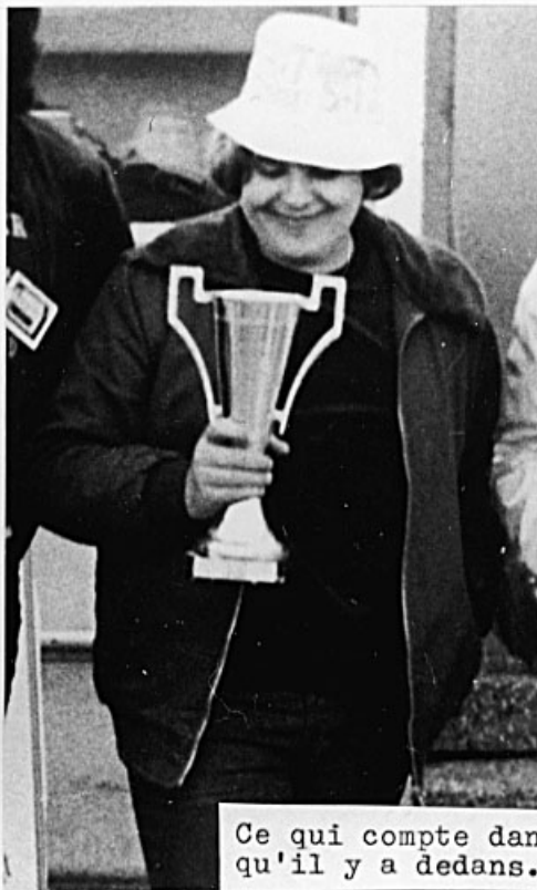
Ce qui compte dans une coupe, c'est ce qu'il y a dedans.