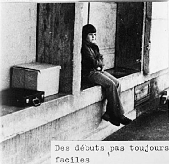
Des débuts pas toujours faciles