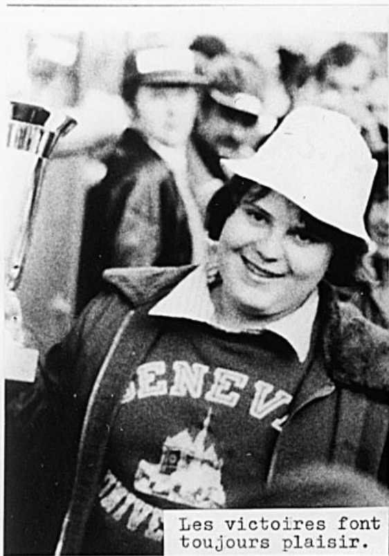
Les victoires font toujours plaisir.