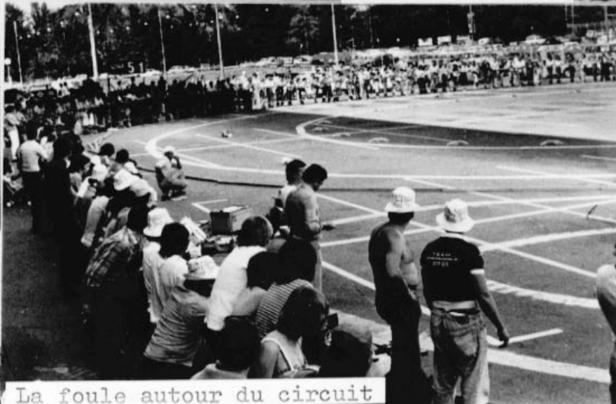
La foule autour du circuit