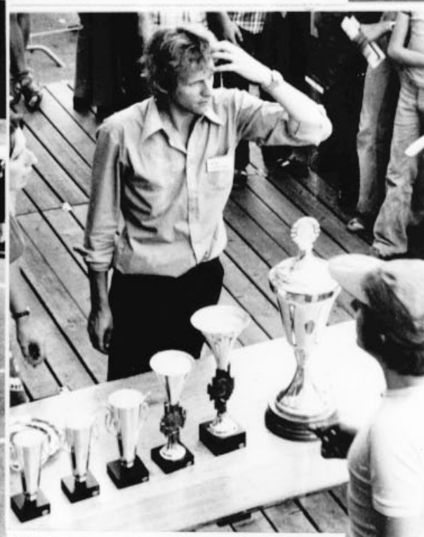
Les soucis du président