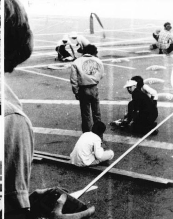
Des problèmes pour tous.