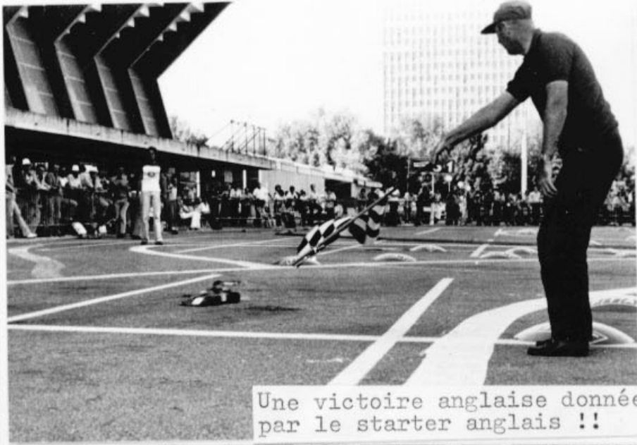
Une victoire anglaise donnée par le starter anglais !!