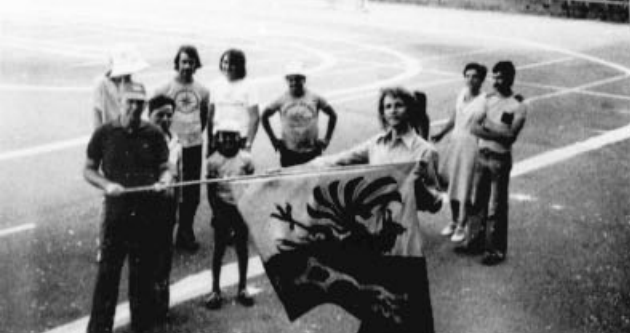
La remise émouvante et solennelle du drapeau.