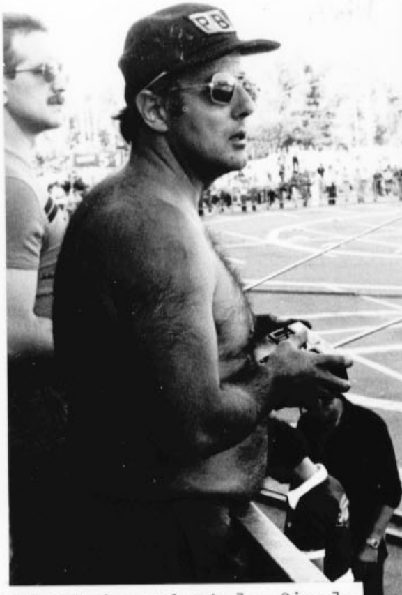
Plested pendant la finale