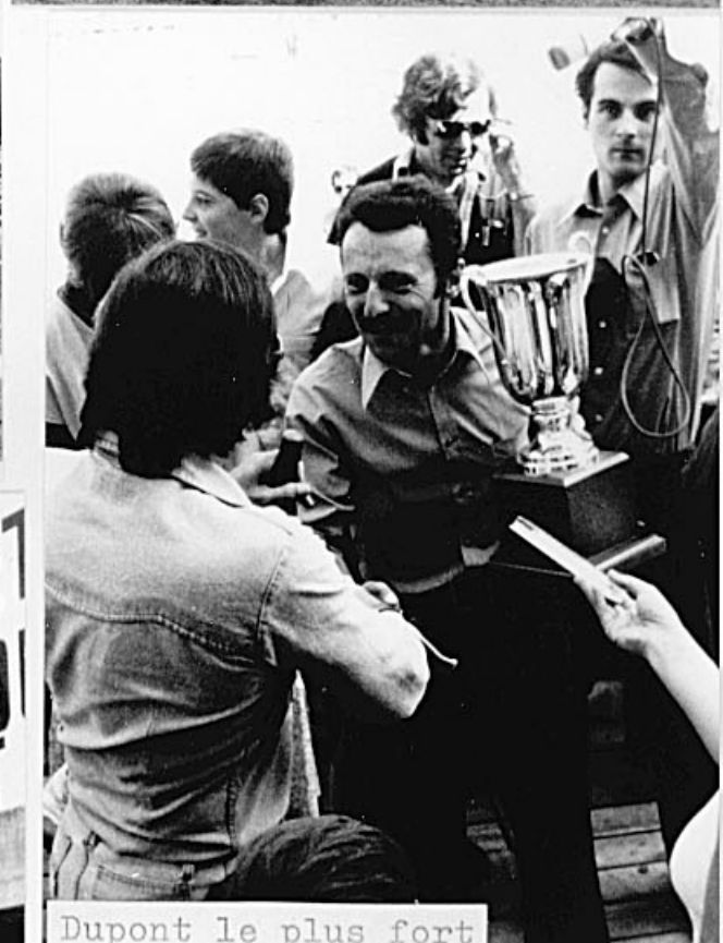
Dupont le plus fort