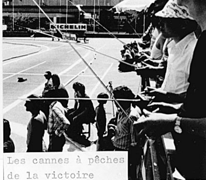
Les cannes à pêches de la victoire