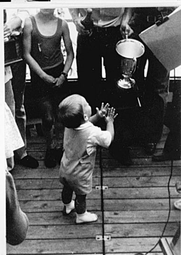
Le fils fittipaldi apprécie, et félicite