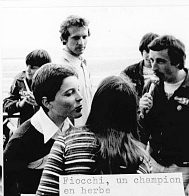
Fiocchi, un champion en herbe