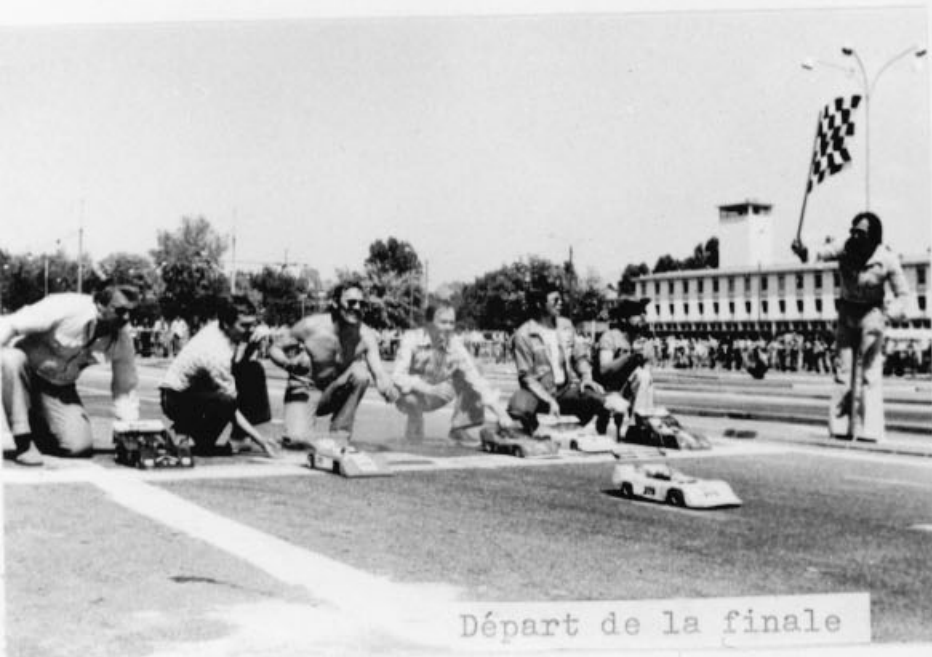
Départ de la finale