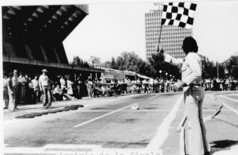
Arrivée de la finale