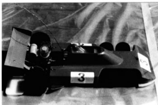
La nouvelle Micro Racing qui faisait ces débuts en compétition.