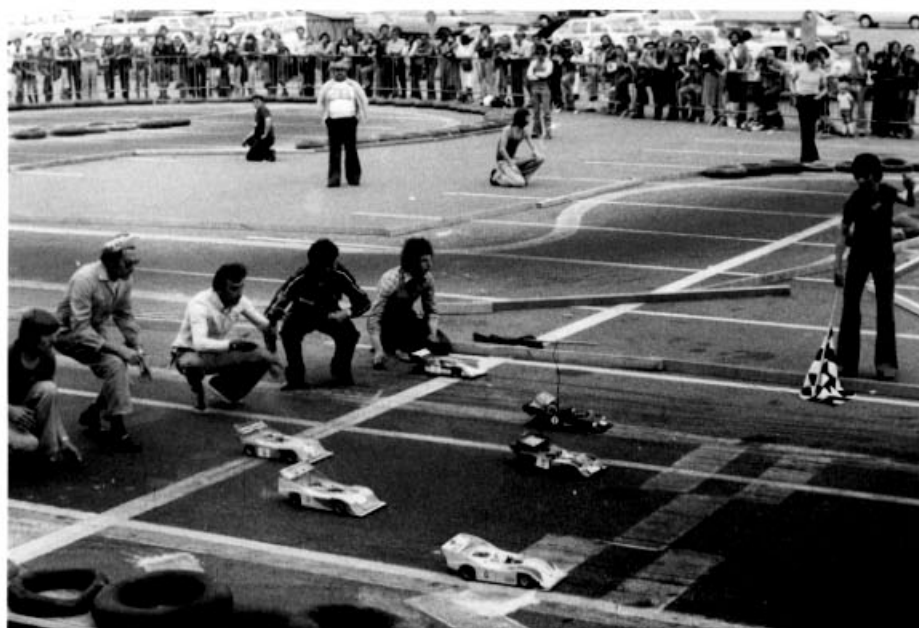
Départ de la finale