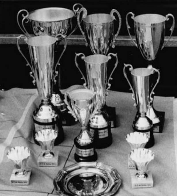
Prix G.P. Prototype