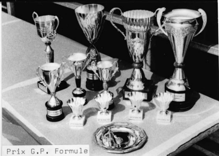
Prix G.P. Formule